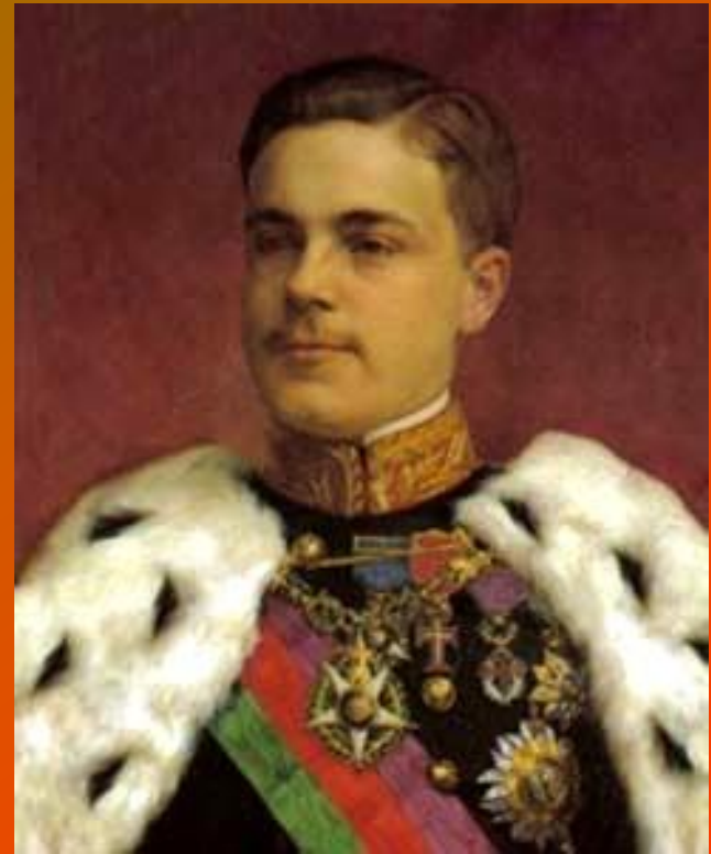
D. Manuel II – O Desventurado (1908 – 1910)