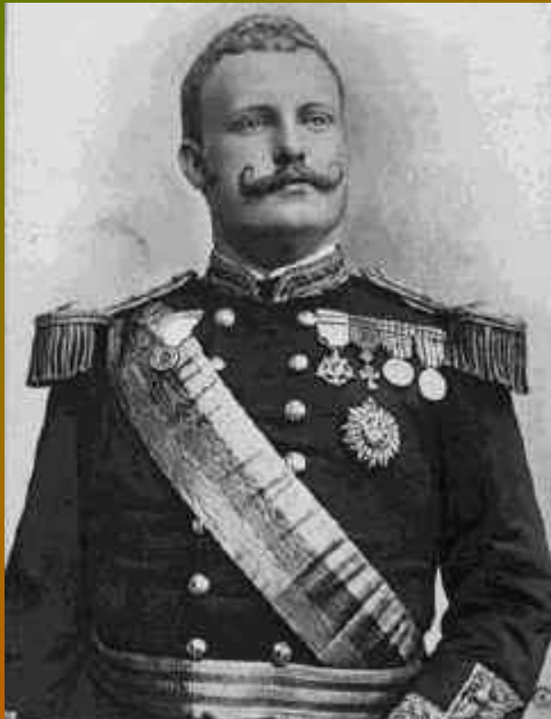
D. Carlos I - O Diplomata (1889 – 1908)