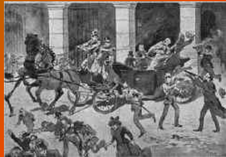
O Regicídio (1908)