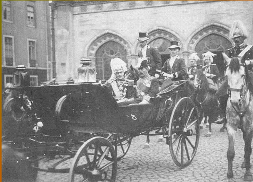
D. Manuel II