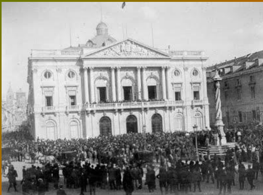
NA PRAÇA DO MUNICIPIO OS LISBOETAS ASSISTEM À PROCLAMAÇÃO DA REPUBLICA