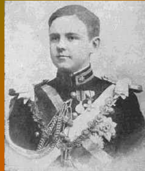
Príncipe D. Luis Filipe